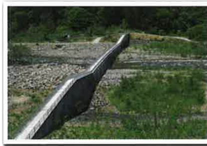
大暗きよ砂防堰堤