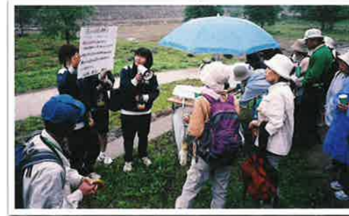
西信中学校の生徒たちが、「荒井堰」「霞堤」「地蔵原堰堤」「水林自然林の野草、野鳥」など、自分たちで調べて、わかりやすくご案内します。