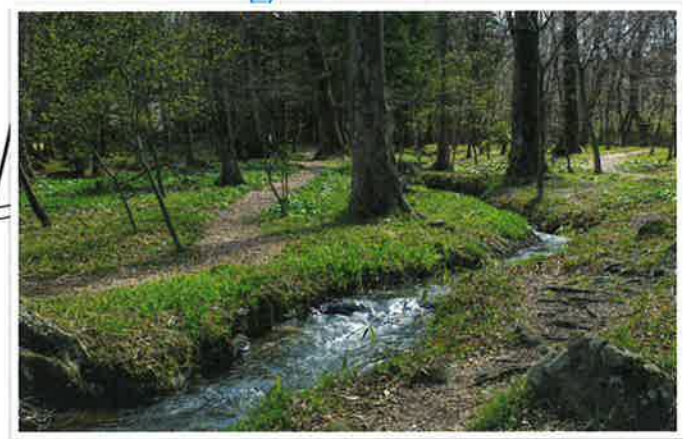
NHK朝ドラ「エール」オープニングの主人公の立ち位置