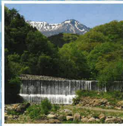
下流から鬼面山を望む