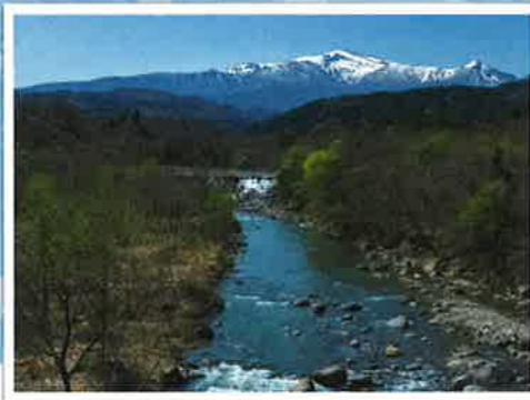
安達太良連峰を望む