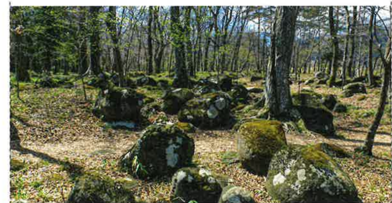
NHK朝ドラ「エール」オープニングの主人公の妻の立ち位置

注意事項 ●レクリエーション保険に加入(保険範囲での対応) ●マスクの着用、密接を避ける ●ゴミの持ち帰り厳守とコース内での禁煙 ●ペット同伴は禁止