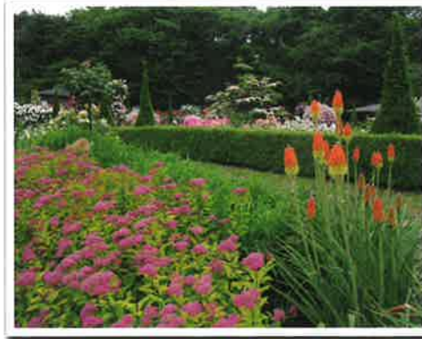
四季の里ハーブ園